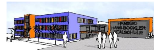
HANSIBO HANSBÖCKLER REALSCHULE